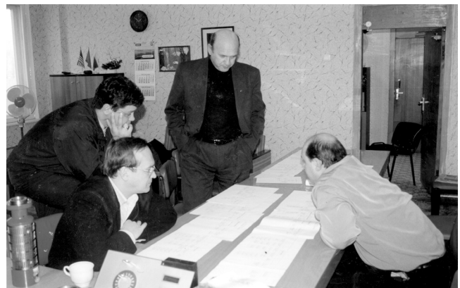
Основатели компании за обсуждением стратегии. Начало 2000-х гг.

Использовали существующий опыт, брали все лучшее, анализировали отзывы нефтяников. Учтя все замечания и предложения, разработали свою уникальную гидрозащиту двигателя.