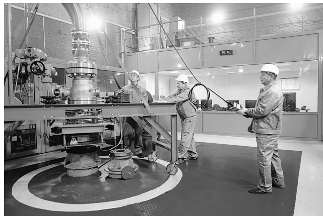
ОКБ БН, Стенд КИВУ

В современном нефтяном машиностроении выигрывает тот, чье оборудование позволяет добывать больше нефти при меньших затратах, а сервисные центры на местах обеспечивают оптимальные условия для его работы. Бесспорным конкурентным преимуществом является наличие инноваций, без которых невозможно движение вперед.